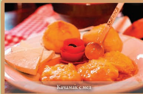
Качмак с мед