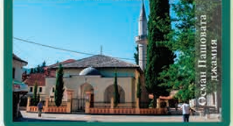
Осман Пашовата джамия