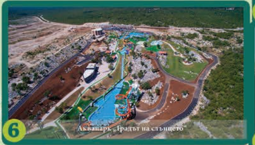
6 Аквапарк „Градът на стъпцето“