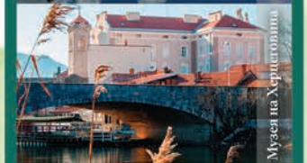
Музея на Херцеговина