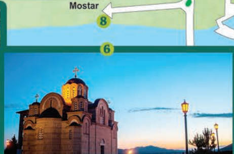
7 Херцеговачка Грачаница