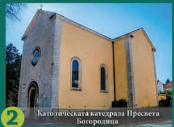
2 Католическата катедрала Пресвета Богородица