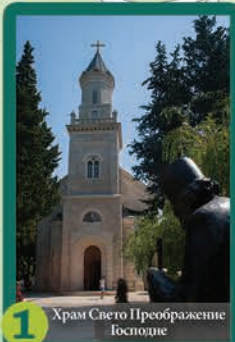
1 Храм Свето Преображение Господне

Центърът е доминиран от стария град "Кастел", заобиколен от крепостни стени от периода на Османската империя, с две джамии в центъра, Султан Ахмедовата и Осман Пашовата, както и Музея на Херцеговина, който може да ви помогне да се докоснете до богатата и далечна история на Требине, а също ви позволява да видите и част от подаръците на Дучич за града.