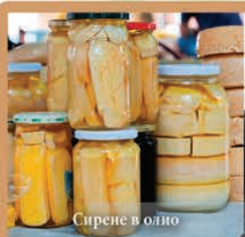
Сирене в олио