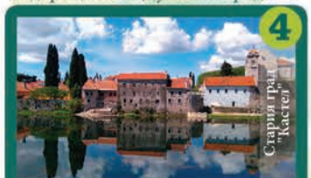
4 Старият град "Кастел"