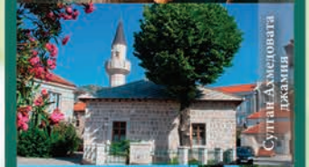
Султан Ахмедовата джамия