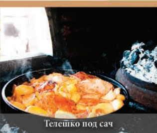
Телешко под сач