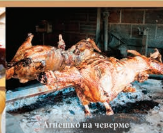
Агнешко на чеверме