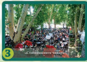
3 Стогодишните чинари