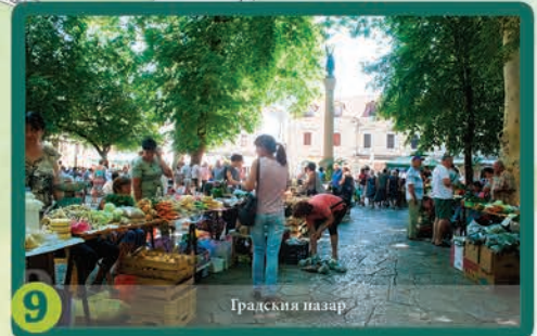
9 Градския пазар

Със своето спокойно течение, в сини нюанси, през сърцето на града преминава река Требишница, чиито брегове са свързани от няколко моста, единият от които е Перович (Арсланagic). Мостът е перла на османската архитектура, който се счита за един от най-красивите мостове в Босна и Херцеговина.