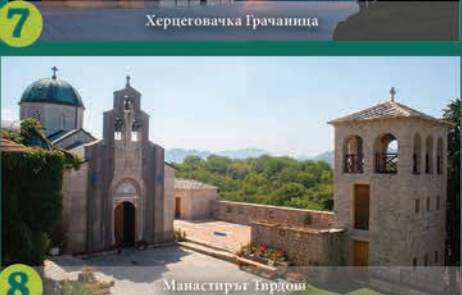
8 Манастирът Тврдош