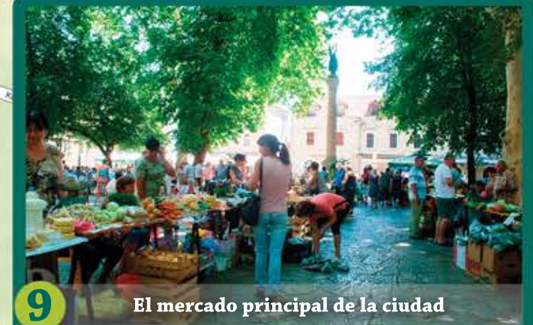
9 El mercado principal de la ciudad

Los vendedores alegres ofrecen una gran cantidad de productos nacionales, y usted tendrá la oportunidad de