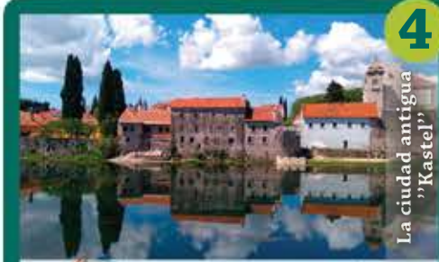
4 La ciudad antigua "Kastel"