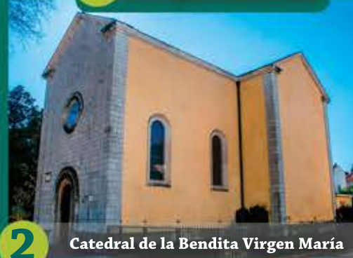
2 Catedral de la Bendita Virgen María