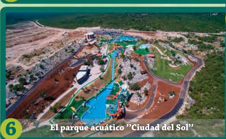
6 El parque acuático "Ciudad del Sol"