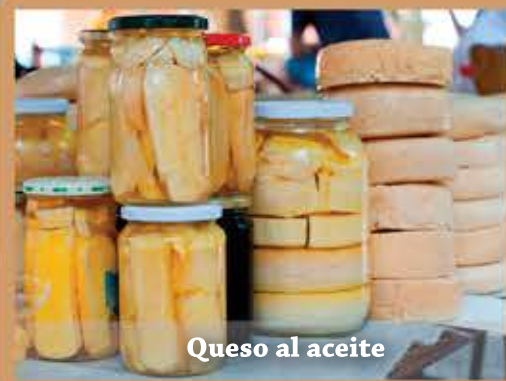
Queso al aceite