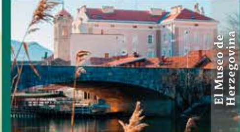
El Museo de Herzegovina