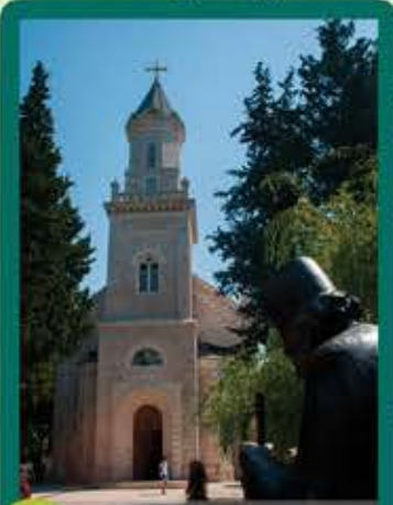
1 Iglesia de la Santa Transfiguración del Señor

El centro de la ciudad es más reconocible por la ciudad antigua "Kastel" rodeado de muros del periodo otomano. En su centro se encuentran dos mezquitas- mezquita de Sultán Ahmed y mezquita de Osman Pachá junto con el Museo de Herzegovina que le ayudará a experimentar una historia antigua y rica de Trebinje y también podrá ver una parte de los regalos que hizo Ducic a su ciudad.