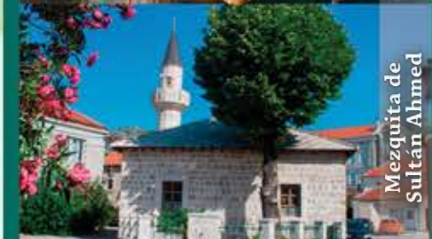
Mezquita de Sultán Ahmed