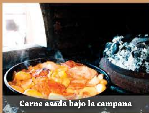
Carne asada bajo la campana