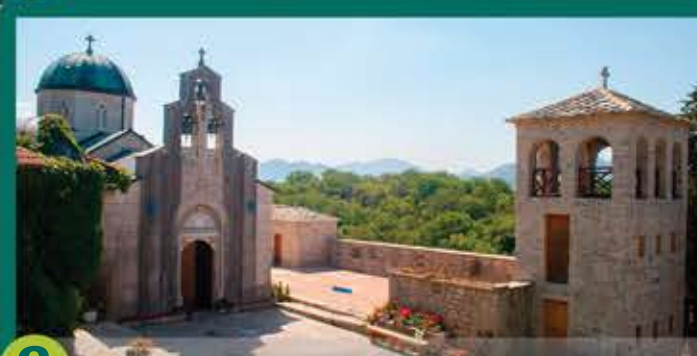
8 El monasterio Tvrdos

actividades que garantiza un montón de diversión para todos sus visitantes. Si busca la mejor vista que da sobre la ciudad, tiene que subir al monte Crkvina donde yace la joya de Herzegovina-monasterio Hercegovacka Gračanica, el lugar donde descansa nuestro poeta Jovan Ducic, nacido en Trebinje. Este lugar ofrece una vista magnífica sobre la ciudad donde encontrará una paz especial, y por la noche disfrutar en variedad de colores de la puesta de sol.