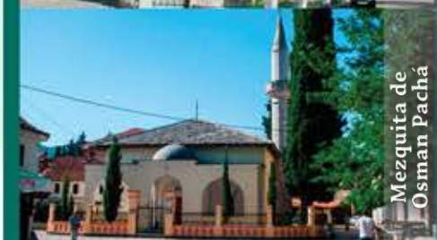
Mezquita de Osman Pachá

En sus tonos de azul, el río Trebisnjica fluye tranquilamente por el centro de la ciudad. Sus orillas están conectadas con varios puentes y uno de ellos, Perovic (Arslanagic puente) es una joya de la arquitectura otomana y el que consideran uno de los puentes más bonitos de Bosnia y Herzegovina.