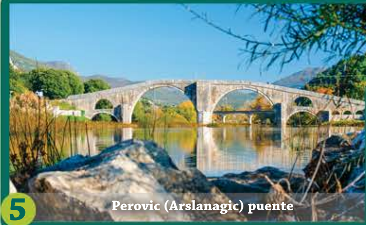
5 Perovic (Arslanagic) puente