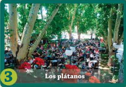
3 Los plátanos

Para los con el espíritu aventurero, puede probar el piragüismo, buceo o la pesca, y para los que buscan un ocio más tranquilo, recomendamos un paseo agradable por las orillas del río Trebisnjica. En verano puede refrescarse en muchos sitios de picnic a lo largo del río Trebisnjica y su afluente Susica, en el parque acuático "Ciudad del Sol" que ofrece una selección amplia de