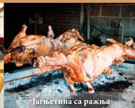
Јагњетина са ражња