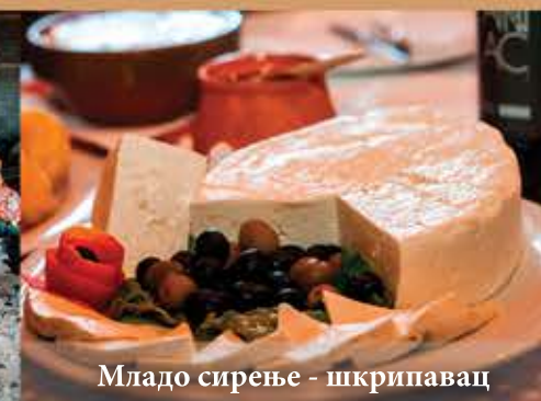
Младо сирење - шкрипавац