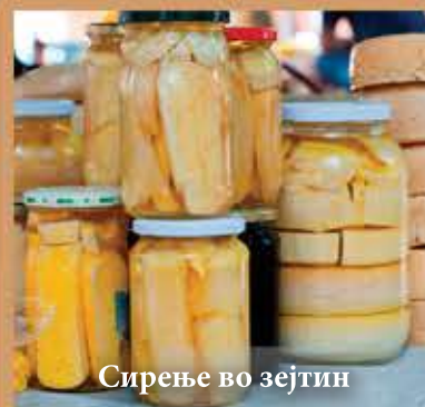
Сирење во зејтин