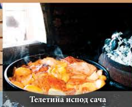
Телетина испод сача