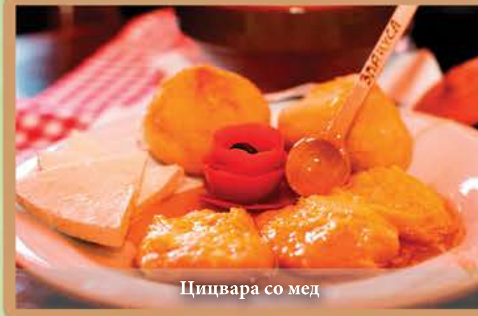
Цицвара со мед