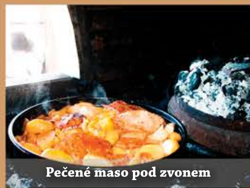
Pečené maso pod zvonem