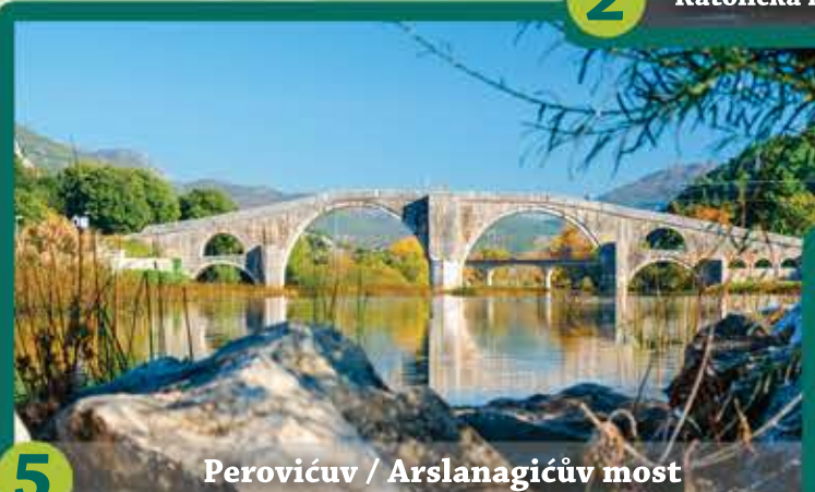
5 Perovićův / Arslanagićův most