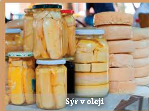
Syr v oleji