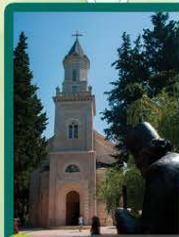
1 Pravoslavná církev Svaté Přeměny Páně

Centrum města je nejznámější pro staré město "Kastel", ohraničené hradbami z osmanského období. Nacházejí se zde dvě mešity - mešita Sultána Ahmeda a mešita Osman-pasha, stejně jako Muzeum Hercegoviny, kde můžete prožít starobylost a bohatou historii Trebinje a také si prohlédnout výběr Dučićových dáreků městu Trebinje.