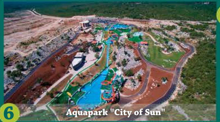
6 Aquapark "City of Sun"