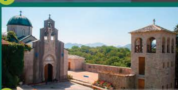
8 Klášter Tvrdos

Pokud hledáte nejlepší pohled na město, měli byste vylézt nakopec Crkvina, kde leží klenot Hercegoviny - klášter Herzegovacka Gracanica, odpočinkové místo našeho básníka Jovana Dučiće z Trebinje. Tato lokalita nabízí nádherný výhled na město, kde najdete klid při barevných západech slunce.