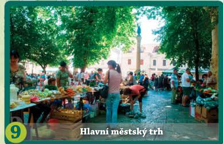
9 Hlavní městský trh

Po krátké přestávce doporučujeme navštívit jednu z mnoha vinic, kdemá každý hostitel zajímavý příběh, který si můžete